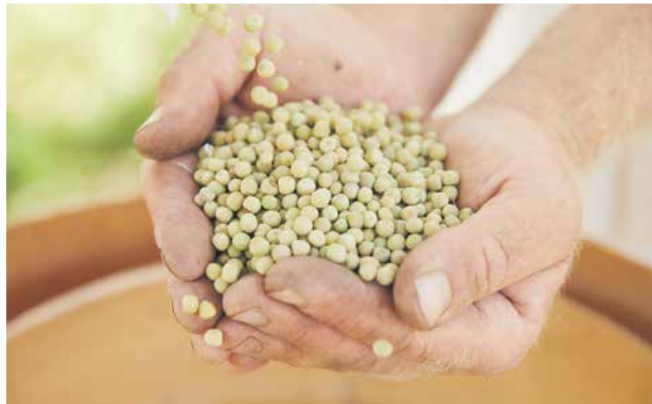
Saatgutrechtsreform muss auch Bauern und Bäuerinnen in den Blick nehmen

Veraltete Regeln aus den 1960er Jahren hatten vor allem die Schaffung einer konkurrenzfähigen Saatgutindustrie für eine vermeintliche Hochleistungsproduktion zum Ziel. Damals setzte man auf Industrie-Saatgut, um den Hunger zu besiegen. Was einst breit akzeptiert und auf ersten Blick erfolgreich war, entpuppte sich als Sackgasse. Die Klimakrise und der dramatische Verlust an Biodiversität sind heute drängende Probleme, zu deren Lösung ein modernes Saatgutrecht seinen Beitrag leisten muss! Ohne Vielfalt gibt es keine Anpassung an immer heißeres und trockeneres Klima, die Vielfältigkeit der Ernährung leidet, das kulturelle Erbe der Züchtung ist bedroht und nicht zuletzt ist der Verlust an Farben, Formen und Geschmack an sich ein unglaublicher Verlust. Vielfalt auf dem Feld („Agro-Biodiversität“) hilft gegen die Klimakrise und ist Grundstein für eine nachhaltige und widerstandsfähige Landwirtschaft. Allerdings nur dann, wenn das neue EU-Saatgutrecht nicht querschießt. Angesichts des starken Industrielobbyings für einen sorglosen Umgang mit Neuer Gentechnik ist ein Saatgutrecht, das die Vielfalt stärkt, zentral.