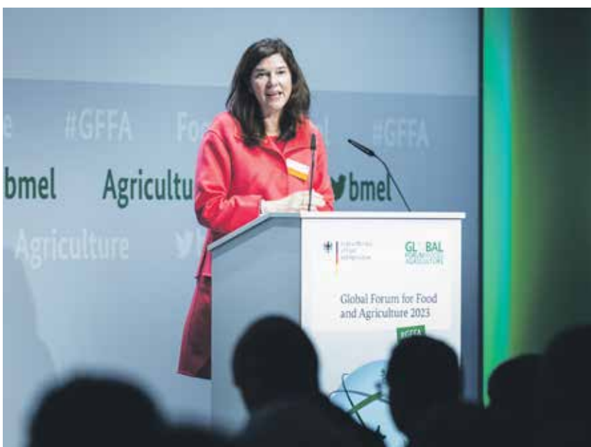
Staatssekretärin Dr. Nick bei der Eröffnung des internationalen Agrarforums

Hinsichtlich der Beratungsangebote sehe ich für außerfamiliäre Hofnachfolgerinnen und -nachfolger noch Ausbaupotenzial. Der Bund führt derzeit Gespräche mit verschiedenen Stakeholdern zur Einführung eines „Inkubator-Trainee-Programmes“. Der Zugang zu Acker- und Grünlandflächen, sowie Kapital muss für Junglandwirtinnen und Junglandwirte erleichtert werden. In diesem Zusammenhang möchte ich jedoch auf das vielfältige Unterstützungsangebot von Bund und Ländern hinweisen, auf das junge Bäuerinnen und Bauern bereits zugreifen können. Im Rahmen des Agrarinvestitionsförderungsprogrammes (AFP) der Gemeinschaftsaufgabe „Verbesserung der Agrarstruktur und des Küstenschutzes“ (GAK) wird ein zusätzlicher Förderzuschuss für Junglandwirtinnen und Junglandwirten gewährt. Darüber hinaus sind über die GAK Beratungsleistungen förderfähig. Zu nennen ist darüber hinaus etwa auch die Stiftung für Begabtenförderung der Deutschen Landwirtschaft, die Weiterbildungsmöglichkeiten anbietet. Im Übrigen ist die Förderung für Junglandwirtinnen und -landwirte aus der 1. Säule auch