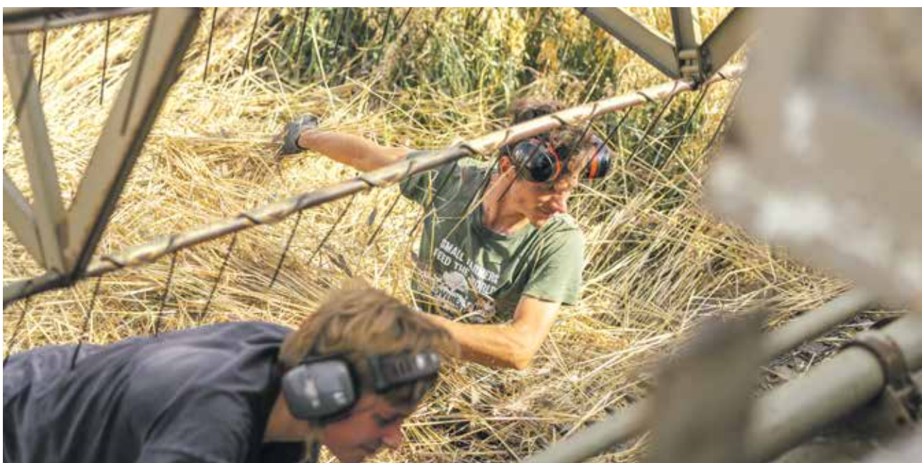
Sigg im Ernteeinsatz vor dem Regen