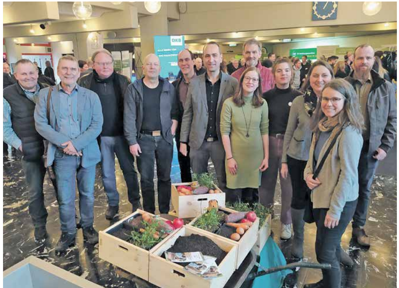
Die AbL-Hessen und die VÖL in Baunatal

Der Hessische Bauernverband hatte auch die Direktorin des Alfred-We-