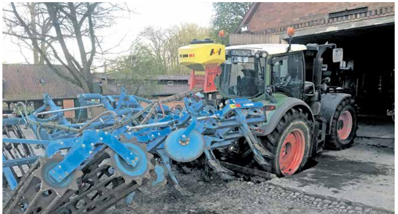
Unfälle passieren - Mitbestimmung bei der Unfallversicherung ist wichtig!