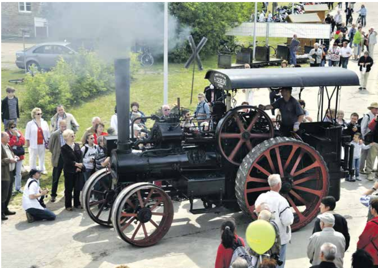
Einst der Motor der Industrialisierung sind Dampfmaschinen heute museale Besonderheiten

Die Landwirtschaft ist ganz klar ein Sonderfall. Andere Branchen müssen ganz entfallen. Zum Beispiel die Flugindustrie, denn klimaneutrales Fliegen gibt es nicht, weil die Herstellung von Ökokerosin zu energieaufwendig ist und außerdem auch dieses Kerosin Kondensstreifen in der Atmosphäre bilden würde, die die Erde zusätzlich aufheizen. Bleibt die Frage, was man mit den 850.000 Beschäftigten macht, die direkt oder indirekt in der Flugbranche tätig sind. Ganz ähnlich verhält es sich mit der Automobilindustrie, die in ihrer jetzigen Form auch keine Zukunft hat, weil die Ökoenergie für die E-Autos nicht reichen wird. E-Autos sind zwar technisch möglich, aber es bleibt eine enorme Energieverschwendung, bis zu zwei Tonnen Material zu bewegen, um im Durchschnitt 1,3 Insassen zu transportieren. Wieder stellt sich die Frage, was aus den 1,75 Millionen Menschen werden soll, die direkt oder indirekt in der Autobranche arbeiten? Dafür brauchen wir eine Lösung.