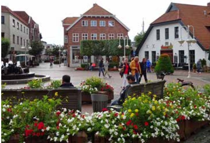
Die Steinhoff-Wurzeln liegen in Westerstede

Die Familienholding Steinhoff hatte 2018 die AbL auf Unterlassung bestimmter, in einer Presseerklärung gemachten Aussagen verklagt. Die AbL hatte öffentlich die Verantwortlichen in der Politik aufgefordert, bei einer eventuellen Insolvenz des Möbelriesen die landwirtschaftlichen Flächen an bäuerliche Betriebe zu vergeben, statt an einen außerlandwirtschaftlichen Investor. Die AbL hatte das Verfahren vor dem Verwaltungsgericht in Berlin gewonnen. gj