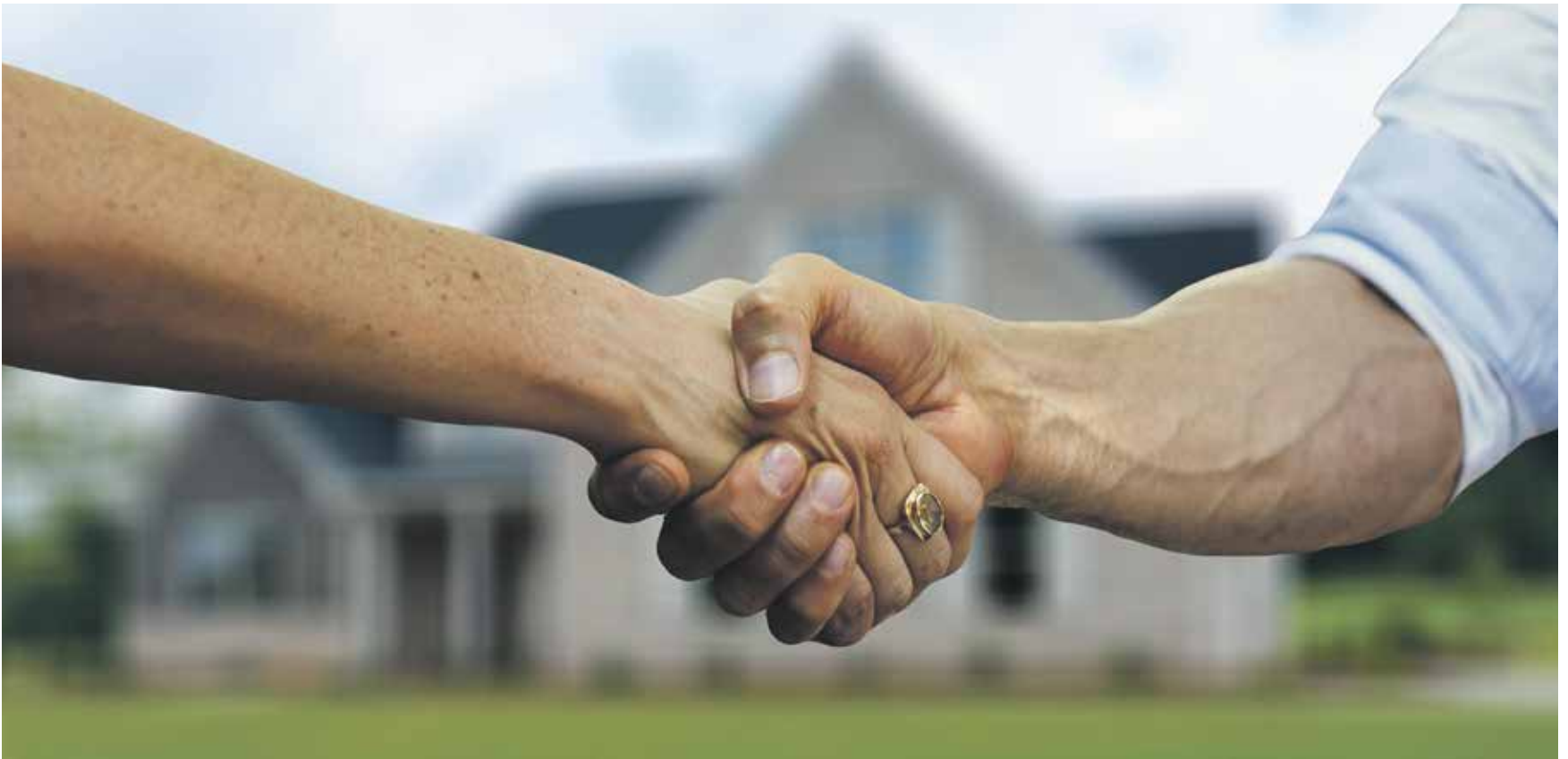
Hofübergaben gehören zu den größten landwirtschaftlichen Herausforderungen