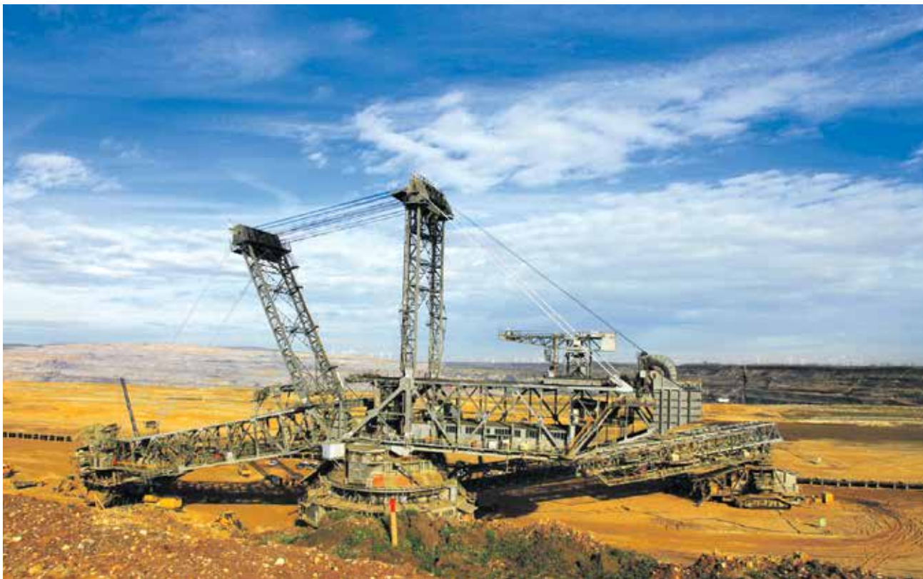
Fossile Energieträger zerstören das Klima und erneuerbare Alternativen sind nur begrenzt verfügbar