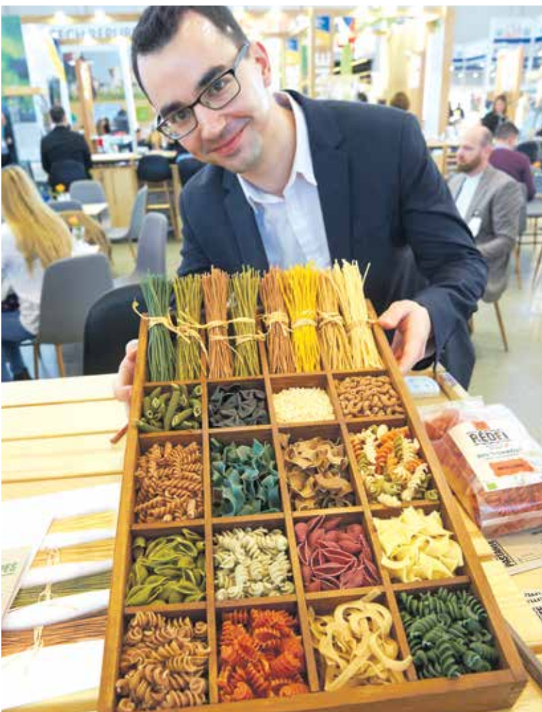
Vielfalt in Bioqualität