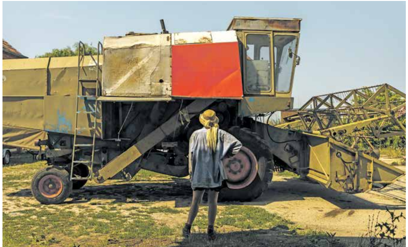
Liebevoll aufgemöbelt und hört auf den Namen „Sigg“, Mährescher der Marke Fortschritt

Auf dem Hof Basta im östlichen Brandenburg wird seit 2010 Biogemüse produziert. Kosten, Ernte und Risiken werden solidarisch mit einer Versorgungsgemeinschaft von ca. 150 Haushalten geteilt. Diesen Ansatz überträgt das Hof-